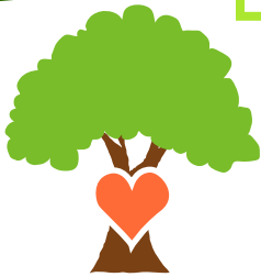
Árbol con piedras de corazon