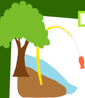
Barra de Grava