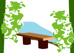
Banco del Río