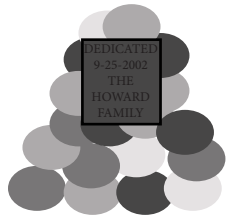
placa de Dedicación