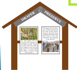
El quiosco de Draper