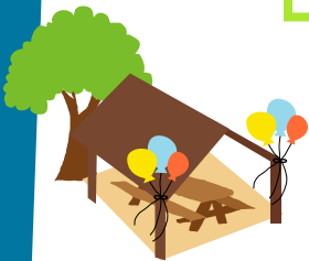
Pabellón de Picnic