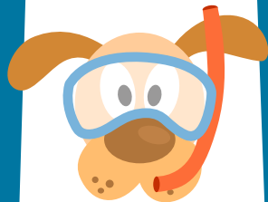
Playa para perros