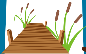
Malecón de Crooked Creek